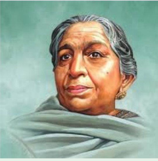
నాయుడు కొన్నిరచనలు: ?గోల్డెన్ ట్రెషోల్డ్ అనే మొదటి కావ్య సంకలనాన్ని ఆమె 1905లో ప్రచురించారు.?ది బర్డ్ ఆఫ్ టైం: సాంగ్స్ ఆఫ్ లైఫ్ డెత్ అండ్ ది స్ప్రింగ్.?ది ఇండియన్ వీవర్స్.?ది బాంగిల్ సెల్లెన్స్..అంతర్జాతీయ మహిళా దినోత్సవాన్ని ప్రతి సంవత్సరం మార్చి 8న ప్రపంచవ్యాప్తంగా జరుపుకుంటారు. =====

ఉద్యమం మరియు క్విట్ ఇండియా ఉద్యమానికి నాయకత్వం వహించిన ప్రధాన వ్యక్తులలో సరోజిని ఒకరు. ఆ సమయంలో బ్రిటిష్ అధికారులచే ఆమె పదే పదే అరెస్టులను ఎదుర్కొంది మరియు 21 నెలలకు పైగా (1 సంవత్సరం 9 నెలలు) జైలులో గడిపింది. ఆమె 1925లో భారత జాతీయ కాంగ్రెస్ అధ్యక్షురాలిగా నియమితులయ్యారు మరియు తరువాత 1947లో యునైటెడ్ ప్రావిన్సెస్ గవర్నర్ అయ్యారు, భారతదేశంలో గవర్నర్ పదవిని నిర్వహించిన మొదటి మహిళగా నిలిచారు. ఆమె అనిబెసెంట్ తర్వాత జాతీయ కాంగ్రెస్ పార్టీకి రెండవ మహిళా అధ్యక్షురాలిగా 1925లో ఎన్నికయ్యారు. ఆమె 1928లో దేశంలో ప్రభుత్వం ఖైసర్ ఏ హింద్ బిరుదును అందించింది. ఆమె 1947 నుండి 1949 వరకు అగ్రా మరియు ఔద్ సమైక్య ప్రావిన్సుకు తొలి గవర్నరుగా నియమించబడి, దేశంలో తొలి మహిళాగవర్నర్ గా చరిత్రకెక్కారు. తన దేశం, దేశమే తనగా భావించి దేశ సేవ చేసిన అభేద భావాల మూర్తి రాజకీయ, సాంఘిక, సాంస్కృతిక, సాహిత్య రంగాలలో రకరకాలుగా సేవలు చేసి మానవ సేవ చేయదలచుకున్న వారికి మార్గాలనేకం అని నిరూపించిన మహిళానితురాలు. జీవితమంతా మానవ సేవకు, దేశసేవకూ అంకితము చేసి తన డబ్బు వ యేట 1949 మార్చి 2 వ తేదీన లక్నోలో ప్రశాంతంగా కన్ను మూసింది. సరోజిని